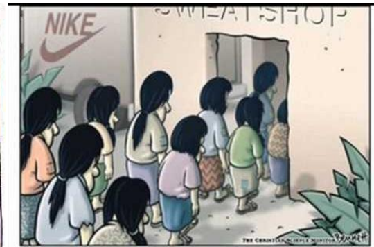
In Indonesia every day is 'take your daughter to work day'. 在印尼，你每天都要帶你的女兒來工作